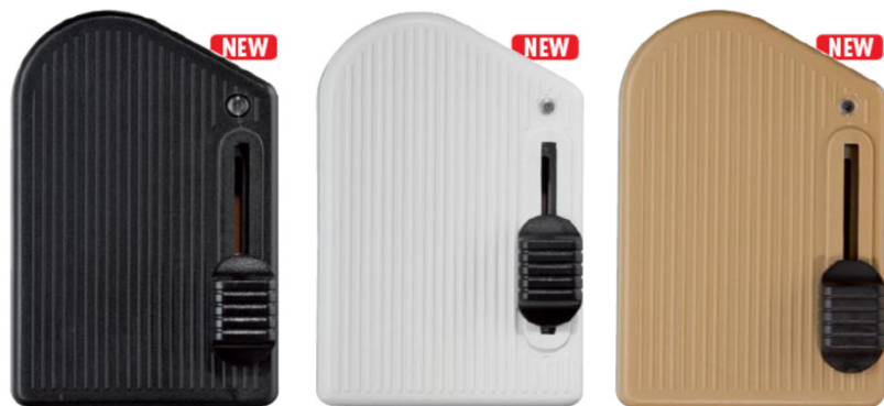
RT81 LED N cod. RL1104/led