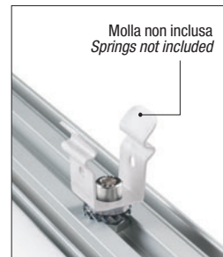
KITB51 - Euro 3,00 Per versione C/Blindosbarra For C/Blindosbarra Version