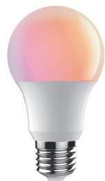
E27 - 1 -