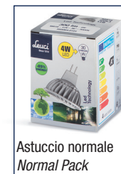
Astuccio normale Normal Pack