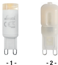
- 1 -