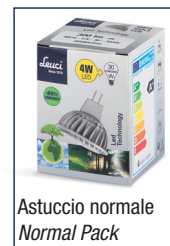
Astuccio normale Normal Pack