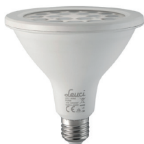
- 1 -