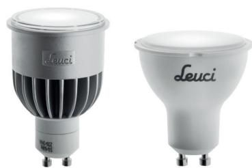
- 1 -