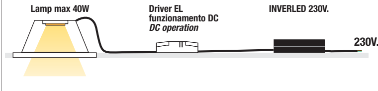
Norme di riferimento