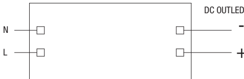
Schema di collegamento - Wiring diagram